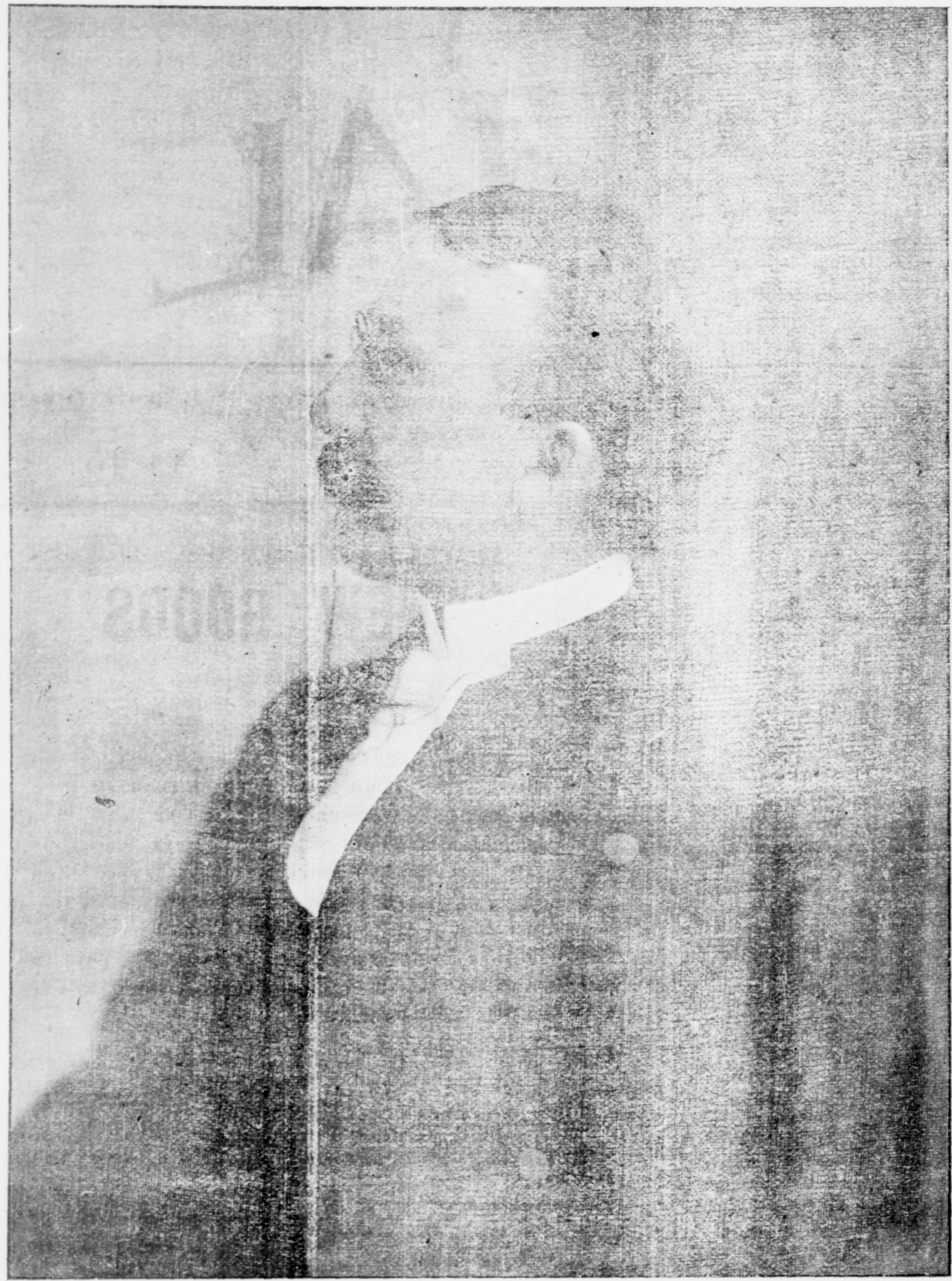
L'HON. PASCAL POIRIER, SÉNATEUR, PRÉSIDENT DE LA CONVENTION NATIONALE A ARICHAT.