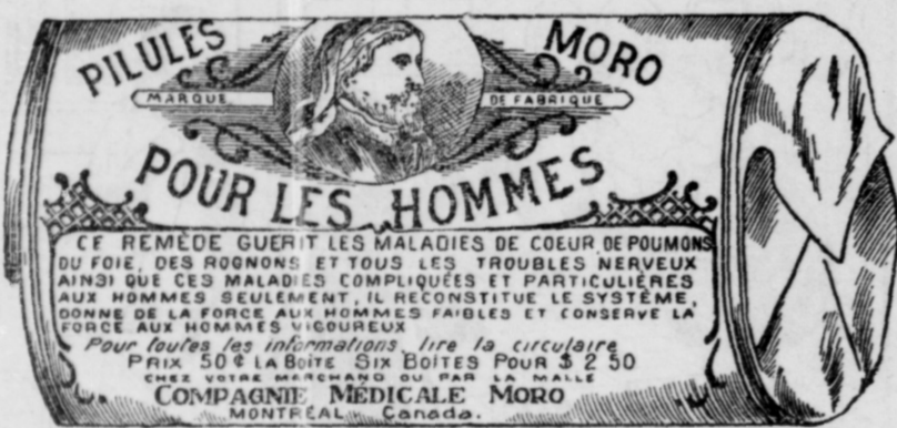
Fac-Simile exact d'une boîte de Pilules Moro.

Donnez-nous un homme brisé par les excès, la dissipation, un travail trop dur, les tracass, ou par toute autre cause qui ait sapé sa vitalité, avec les Pilules Moro nous le rendrons aussi vigoureux en tous points, que n'importe quel homme de son âge.