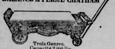
Trois Genres. Capacité 2,000 lbs.

Vous avez besoin d'une balance sur votre ferme. Vous en avez besoin tout de suite. Supposons que vous vendiez des cochons à 5 cents la livre, et que vous vous fiez aux balances de votre marchand, qui sont 1/2 fausses. Cela signifie une perte de 25 cents pour chaque 200 livres de porc. Ensuite vous vendez 100 boisseaux de grain à 75 cents. Les balances du marchand ne sont fausses que de 1/40, mais votre perte est $18.75. La perte sur quelques transactions de cette sorte achèterait une douzaine de balances.