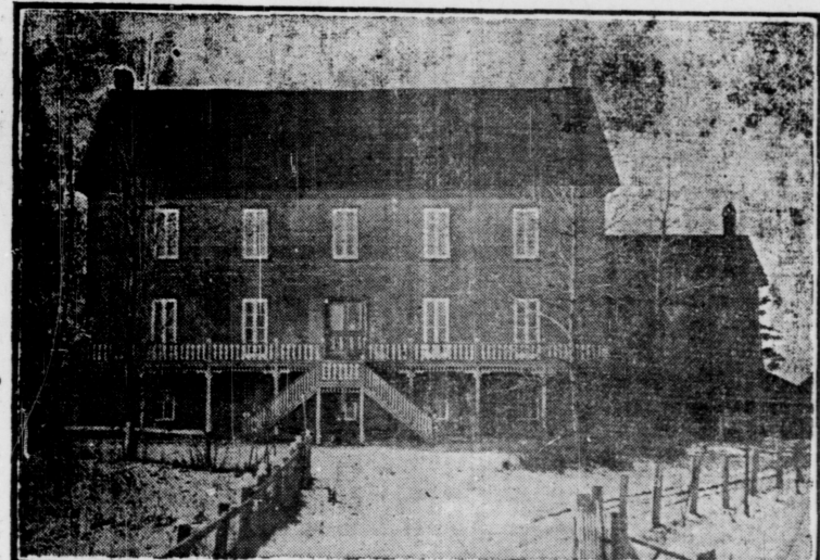
LE COUVENT DE TIGNISH. Cette maison d'éducation est dirigée par les dames de la Congrégation Notre Dame. Cours d'études complet. Adressez-vous à la Révérende Mère Supérieure Tignish, I. P. E.

La province d'Ontario, au contraire, n'a aucune barrière pour la protéger contre l'influence de la grande République voisine et peu à peu elle lui emprunte sa manière de voir, son engouement pour toutes les institutions démocratiques qui dégénèrent rapidement en socialisme; sa manière de pensée qui est absolument contraire à celle qui prévaut en Angleterre, renommée pour sa largeur de vues et sa pondération; sa manière de parler, son langage, car, ici, en Ontario, le langage courant n'est que l'affreux "slang" qui sévit aux États-Unis et que les Anglais d'Angleterre