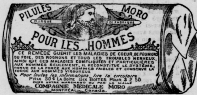
L'Étiquette est de papier blanc imprimé en bleu.

Fac-Simile exact d'une boîte de Pilules Moro.