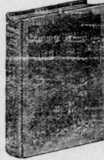
16mo, 144 pages; bound in linen, gilt top.