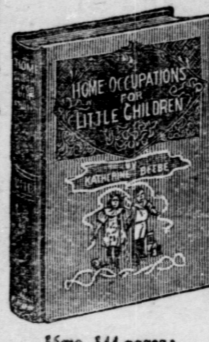
Home, 144 pages; bound in linen, gilt top.