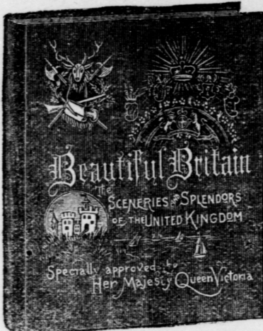
Large quarto volume (11 1/2 x 13 1/2 ins.), 288 pages. Extra enameled paper. Extra English cloth, emblematic embossing in ink and gold.

A magnificent collection of views, with elaborate descriptions and many interesting historical notes. Text set within emblematic borders, printed in a tint. A fine example of up-to-date printing.