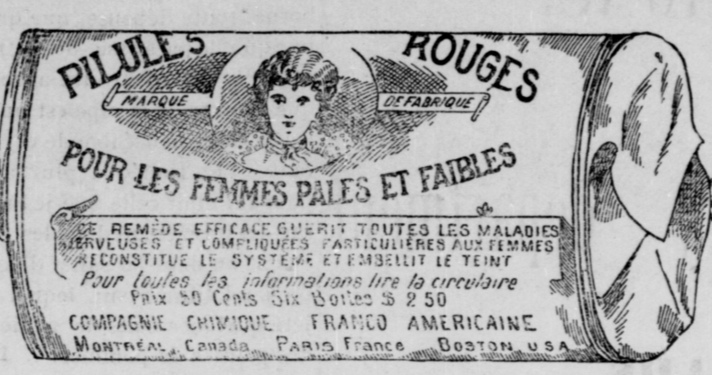
Tas double exact d'une boîte de Pilules Rouges.

Nos Pilules Rouges sont une spécialité pour les maladies des femmes seulement; c'est ce qui fait leur force et leur popularité. Il est impossible à un remède de guérir tous les maux. Jamais, dans l'histoire de la médecine, un remède n'a obtenu autant de guérisons que nos Pilules Rouges.