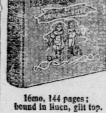
16mo, 144 pages; bound in linen, gilt top.

Home Occupations for Little Children. By KATHERINE BEEBE.