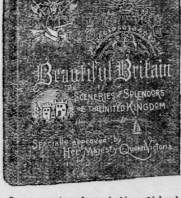
Large quarto volume (11 1/2 x 15 1/2 ins.), 325 pages. Extra enameled paper. Extra English cloth, embossed with gold.

The Scenery and the Splendors of the United Kingdom.