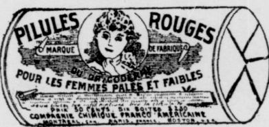
Le papier est blanc imprimé en encre rouge.

Les bureaux de consultations à Montréal sont au No 274 rue St Denis. Ils sont ouverts de 9 hrs a. m. jusqu'à 8 hrs p. m., et les Dames qui désirent demander conseil sont priées de s'y présenter sans crainte. Elles y recevront tout-à-fait gratuitement des avis qui leur seront d'une grand utilité.