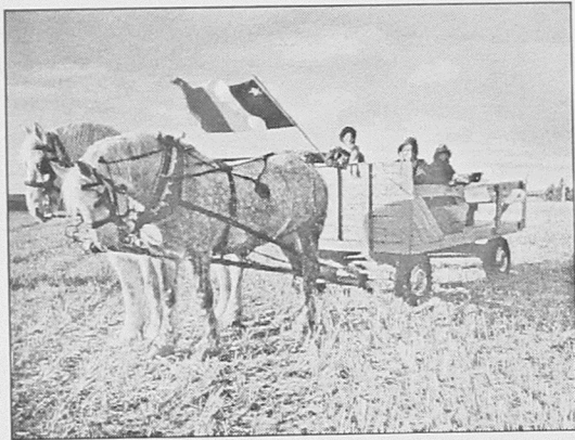
23. Chevaux de Lee Knox, Étang-des-Clous, 1999