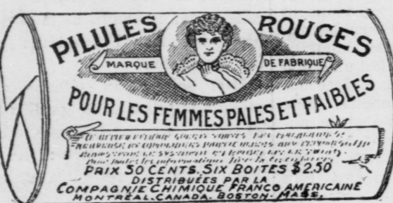
Fac-similé d'une boîte de Pilules Rouges.

COMPAGNIE CHIMIQUE FRANCO-AMERICAINE, 274 rue Saint-Denis, Montréal.