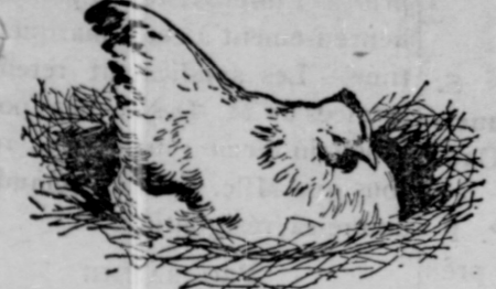
LA POULE COUVEUSE—Son manque de succès a découragé maints éleveurs de volailles.

Vous pouvez faire de l'argent en élevant des poulets suivant la vraie méthode—en ferez abondamment.