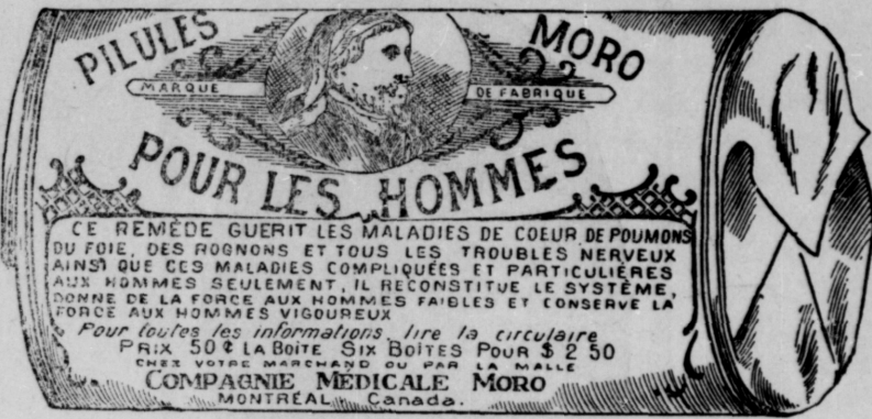
Fac-Simile exact d'une boîte de Pilules Moro.

Donnez-nous un homme brisé par les excès, la dissipation, un travail trop dur, les tracas, ou par toute autre cause qui ait sapé sa vitalité, avec les Pilules Moro nous le rendrons aussi vigoureux en tous points, que n'importe quel homme de son âge.