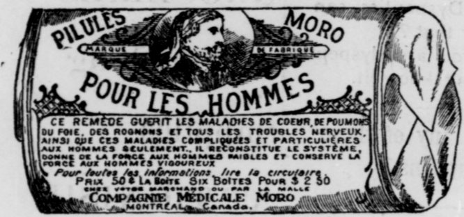
L'Etiquette est de papier blanc imprimé en bleu.

Fac-Simile exact d'une boîte de Pilules Moro.