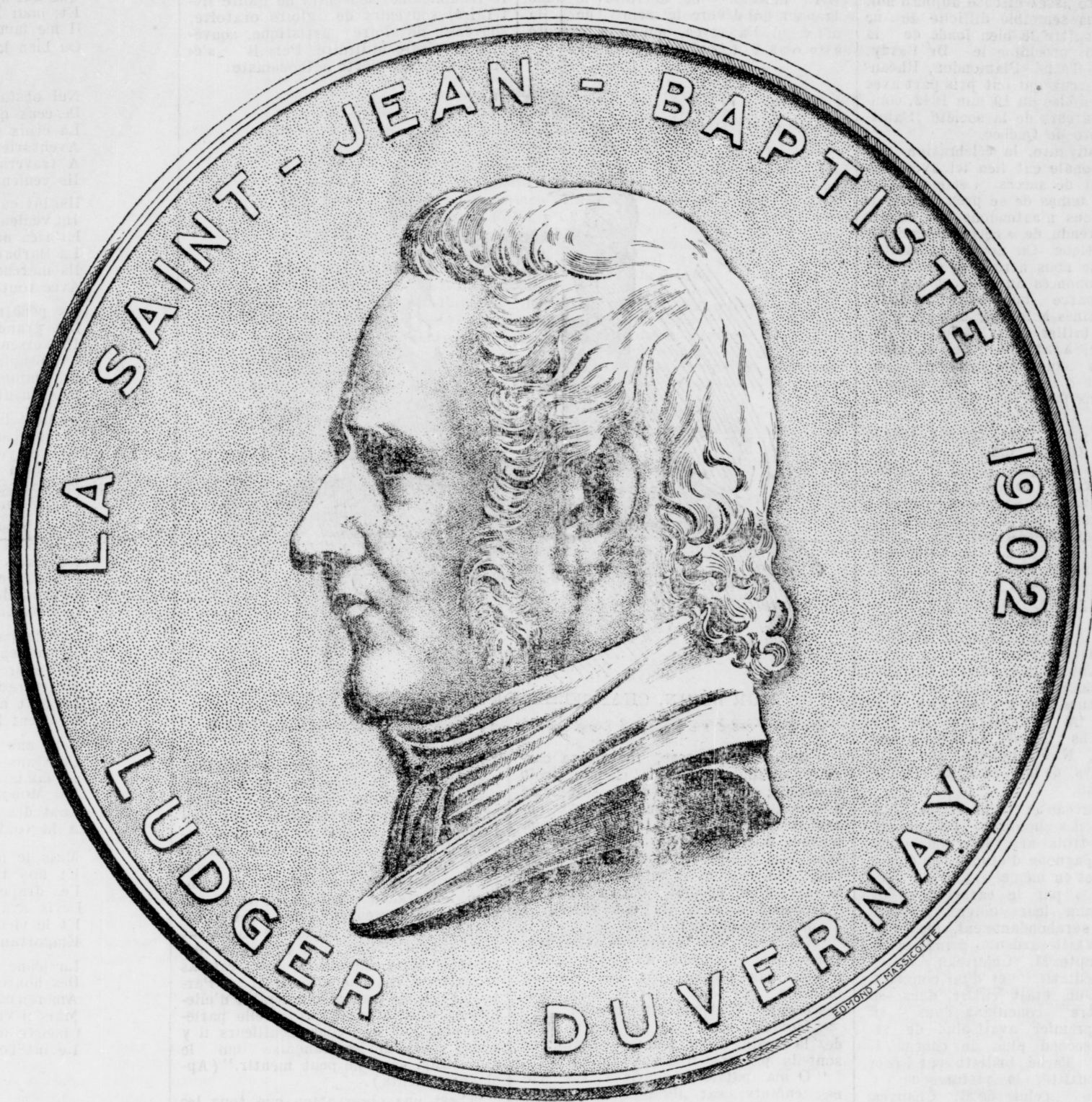
Le fondateur de la Société St-Jean-Baptiste en 1834.