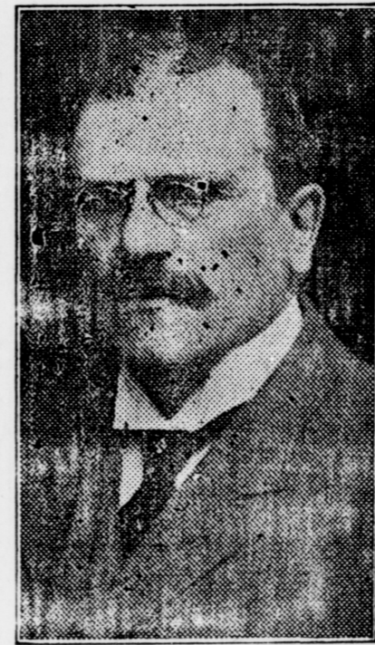
HON. M. BRODEUR, Ministre de la Marine et des Pêcheries. Il est rumeur qu'il donnera sa démission qui sera accueillie avec regret.

Assurément, nous nous sommes laissés émouvoir en notre jeunesse par le douloureux exemple de Gilbert: vous vous rappelez Gilbert, éternellement célèbre parce qu'il s'écria fort à propos sur un ton lamentable: Au banquet de la vie, infortuné convive, J'apparus un jour et je meurs! et parce que, en 1780, n'étant âgé que de vingt-neuf ans — ce qui est un bel âge pour vivre — il mourut, sans aucun doute possible, à l'Hôtel-Dieu. Mais l'impitoyable érudition est venue contrarier notre pitoyable émotion. Et nous sommes obligés de convenir que Gilbert mourut à l'Hôtel-Dieu pour son bien. En effet, Gilbert un jour tomba malencontreusement sur la tête. On dut le trépaner. Il devint fou de la chute ou de l'opération. Et l'archevêque de Paris qui le protégeait le fit admettre à l'Hôtel-Dieu. Mais dans un de ses accès de démence il avala, à l'insu des surveillants, la petite clef d'une cassette où il avait — notez et admirez — de l'argent... Il en mourut; mais nous