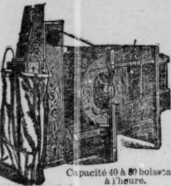
Capacité 40 à 80 boisseaux à l'heure.

Nettoie le Blé, le Seigle, le Trèfle, le Mil, l'Avoine, l'Orge, le Lin, les Pois, les Fèves, le Maïs et toutes graines. Grand Entonnoir, Alimentation à Vis, facile à ajuster. L'agitateur empêche l'engorgement et distribue le grain uniformément sur les grilles. Le Souffleur maintient les grilles nettes—ni autre Crible ne l'a. Secouement à l'extrémité et secouement latéral à ajustement (trois largeurs). Soixante grilles et cribles, graduant quoi que ce soit; de la graine la plus fine au grain le plus grossier. Les grilles sont vernies en laque et ne peuvent rouiller. Les cribles sont conservés et servent de nourriture. Fonctionne facilement et sans bruit; combine la simplicité au mérite. Le Crible Chatham se paiera plusieurs fois dans le cours d'une année. Il est la plus grande source d'économie et de profits qu'il y ait sur la ferme. Il garantit de plus grosses moissons et du meilleur grain. Si n'était pas le meilleur, il ne serait pas actuellement en usage sur des centaines de milliers de fermes en Canada et aux États-Unis. Il se vend avec ou sans Appareil à Empocheur, à votre choix.