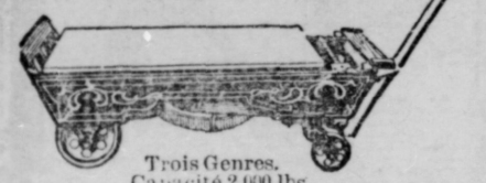
Trois Genres. Capacité 2,000 lbs.

Vous avez besoin d'une balance sur votre ferme. Vous en avez besoin tout de suite. Supposons que vous vendiez des cochons à 5 cents la livre, et que vous vous fiez aux balances de votre marchand, qui sont 120 fausses. Cela signifie une perte de 50 cents pour chaque 200 livres de porc.