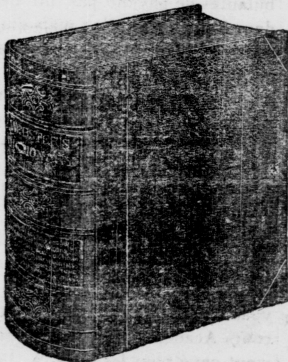
Weight nearly 22 lbs. Size 8 1/2 x 10 1/2 x 4 inches. Full Sheep or Half Russia. With Dennison's Patent Index 25c. extra.

Webster's Dictionary Original Edition, Revised and Enlarged by Chauncey A. Goodrich, Professor of Yale.