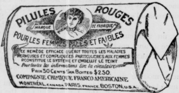
L'Etiquette est de papier blanc imprimé en rouge.

Fac-Simile exact d'une boîte de Pilules Rouges.