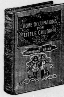
16mo, 144 pages; bound in linen, gilt top.

Hundreds of Hints on How to Make the Little Folks Happy Lists of Stories, Songs and Plays Invaluable to Mothers and Nurses