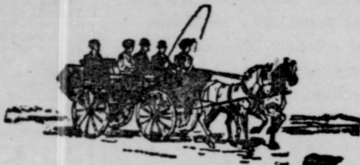
NEW PATIENTS ON WAY TO HOSPITAL

¶ No effort is being spared to meet every call. . . . ¶ Not a single applicant has ever been refused admission to the Free Hospital because of his or her poverty.