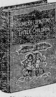
16mo, 144 pages; bound in linen, gilt top.