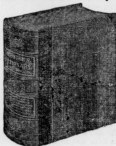
Weight nearly 12 lbs. Size 8 1/2 x 10 1/2 x 4 inches. Full Sheep or Half Russia. With Dennison's Patent Index 25c. extra.