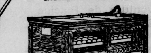
No. 1—60 Oeufs, No. 2—120 Oeufs, No. 3—240 Oeufs

Ceux qui vous disent qu'il n'y a pas d'argent dans l'élevage de poulets ont dû essayer à faire des milliers d'éleveurs de volailles—hommes et femmes par tout le Canada et les Etats-Unis—se sont convaincus qu'il est avantageux d'élever des poulets au moyen de l'Incubateur Chatham et Couveuse.