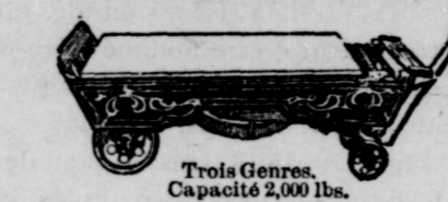
Trois Genres. Capacité 2,000 lbs.

Vous avez besoin d'une balance sur votre ferme. Vous en avez besoin tout de suite. Supposons que vous vendiez des cochons à 5 cents la livre, et que vous vous fiez aux balances de votre marchand, qui sont 120 fausses. Cela signifie une perte de 20 cents pour chaque 200 livres de porc.