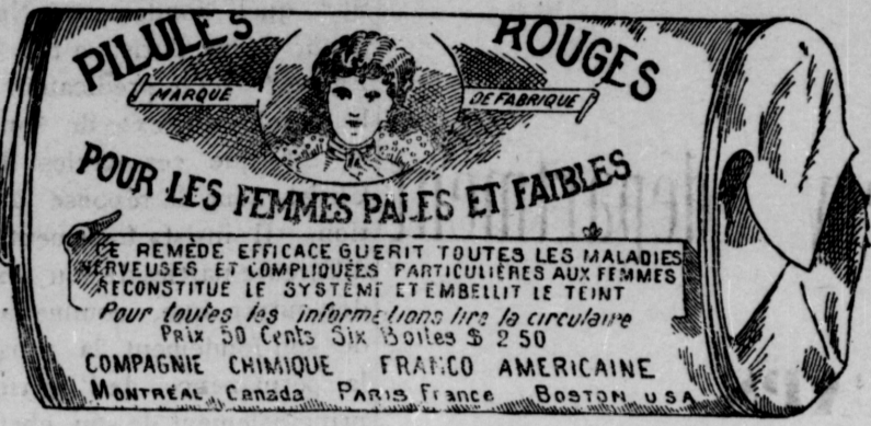
Fac-similé exact d'une boîte de Pilules Rouges.

Nos Pilules Rouges sont une spécialité pour les maladies des femmes seulement; c'est ce qui fait leur force et leur popularité. Il est impossible à un remède de guérir tous les maux. Jamais, dans l'histoire de la médecine, un remède n'a obtenu autant de guérisons que nos Pilules Rouges . Nous demandons à nos nombreuses clientes de ne pas comparer nos Pilules Rouges aux autres remèdes qui guérissent tous les maux, entre autres, aux remèdes liquides qui ne doivent leur effet stimulant qu'à l'alcool qu'ils renferment.