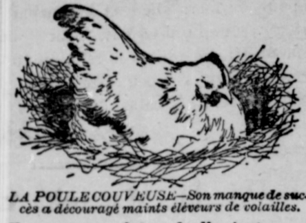
LA POULE COUVEUSE.—Son manque de succès a découragé maints éleveurs de volailles.

Vous pouvez faire de l'argent en élevant des poulets suivant la vraie méthode—en ferez abondamment.