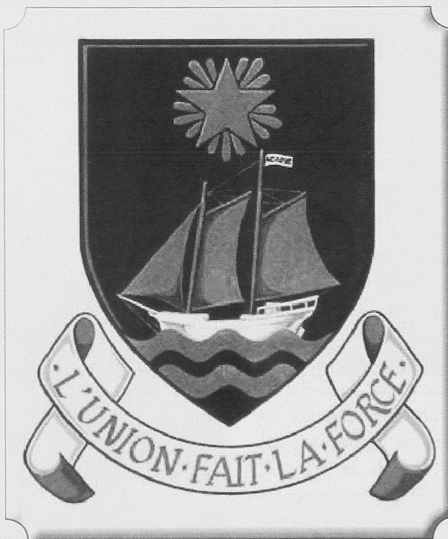
(Société Nationale de l'Acadie)

Insigne de 1884 : bandelette de soie bleue frappée d'une étoile entourée de rayons, vaisseau voguant à pleines voiles avec pavillon ayant le mot Acadie.