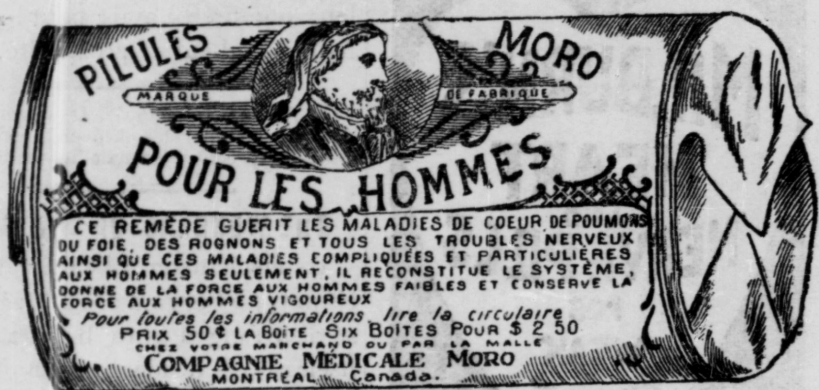
Fac-simile exact d'une boîte de Pilules Moro.

Donnez-nous un homme brisé par les excès, la dissipation, un travail trop dur, les tracas, ou par toute autre cause qui ait sapé sa vitalité, avec les Pilules Moro nous le rendrons aussi vigoureux en tous points, que n'importe quel homme de son âge.