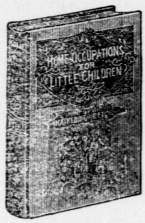
16mo., 144 pages; bound in linen, gilt top.

Hundreds of Hints on How to Make the Little Folks Happy Lists of Stories, Songs and Plays Invaluable to Mothers and Nurses