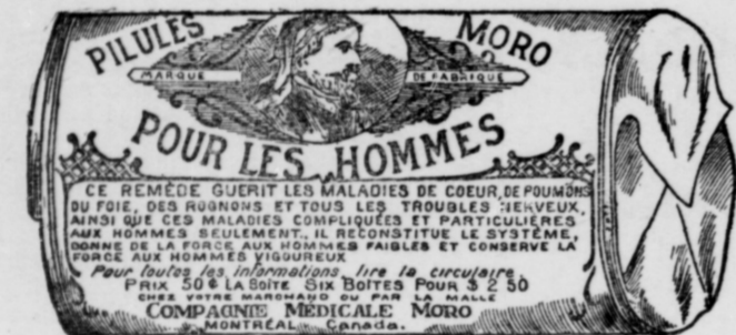
L'Étiquette est en papier blanc imprimé en bleu.

Fac-Simile exact d'une boîte de Pilules Moro.