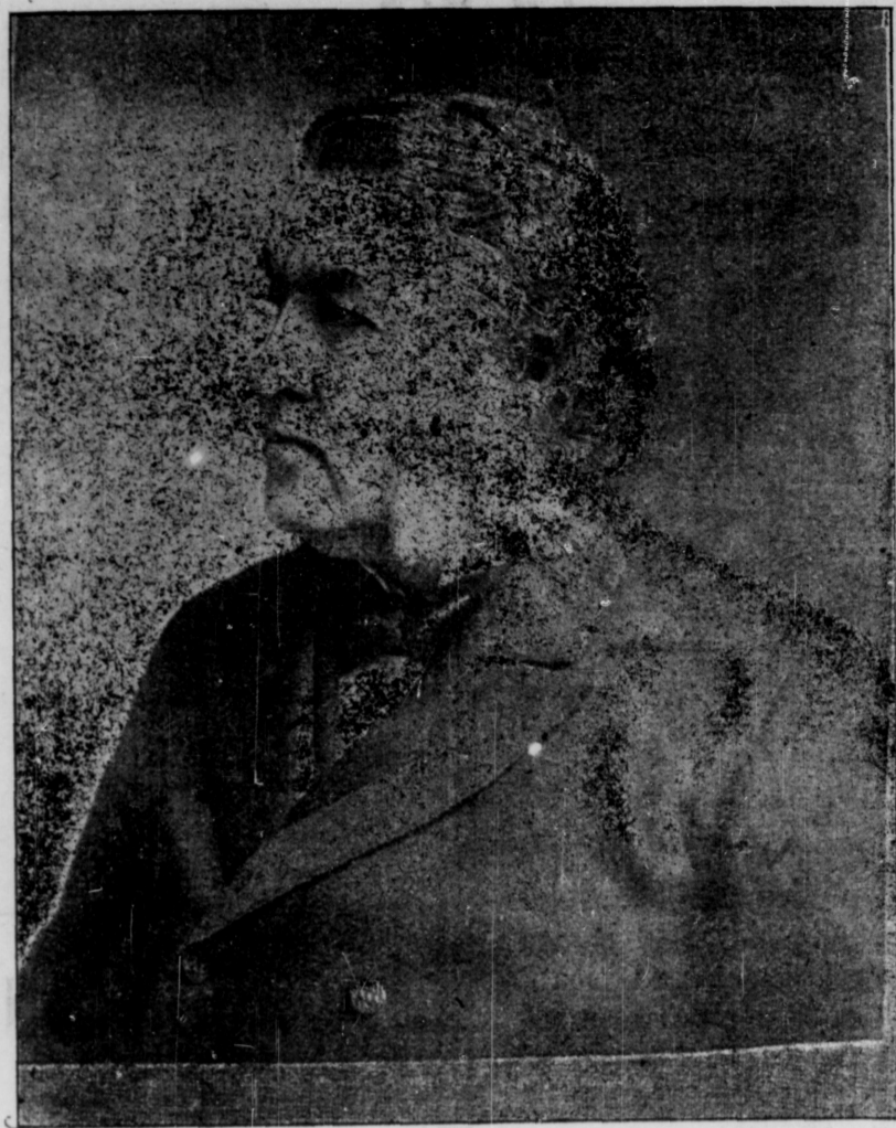
SIR CHARLES TUPPER

Pouvons-nous nous fier à un député qui aurait obtenu son élection par la corruption? Non! Ce député se ficherait de nos intérêts; songerait seulement qu'à se rembourser des dépenses faites pour l'achat des votes. Donc le "Saw off" dont on parle aujourd'hui ne peut être considéré comme justifiable. Nous sommes sous l'impression que ceux qui le désirent sont un peu coupables et veulent s'abriter par ce compromis. Soyons francs et honnêtes. Avançons hardiment. Si nos députés sont déshonnetés mettons les à la porte et remplaçons les pour des hommes dignes de respect, possédant assez de force morale par ne pas se laisser entraîner dans des compacts malhonnêtes. Il y va de notre plus grand intérêt de n'avoir, pour nos députés, que des hommes honnêtes, sobres, habiles et instruits, en un mot, ayons nos meilleurs hommes comme nos députés et nous aurons nos droits.