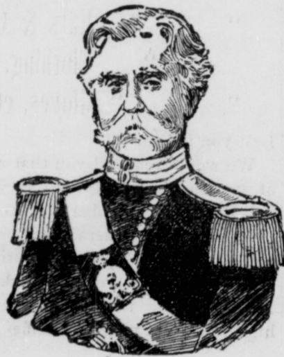
LE PRINCE TUMANOFF.

Des dépêches de Tiflis annoncent que le Prince Tumanoff, inspecteur de chemin de fer, a été assassiné, le 12, par un conducteur de char, à la station Actohalia.