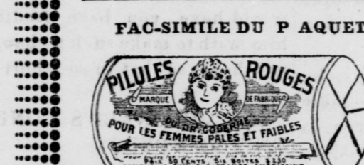
Le papier est blanc imprimé en encre rouge.