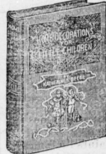
16mo., 144 pages: bound in linen, gilt top.