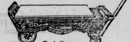
Trois Genres. Capacité 2,500 lbs.

Vous avez besoin d'une balance sur votre ferme.