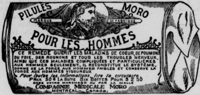
L'Etiquette est de papier blanc imprimé en bleu.

Fac-Simile exact d'une boîte de Pilules Moro.