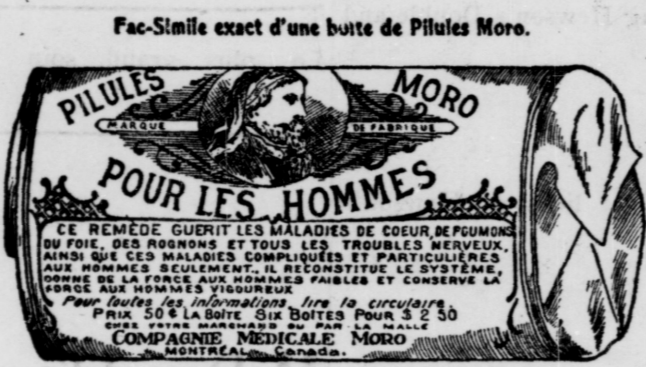
L'Étiquette est de papier blanc imprimé en bleu.

COMPAGNIE MEDICALE MORO, 1724, rue Ste-Catherine, Montréal.