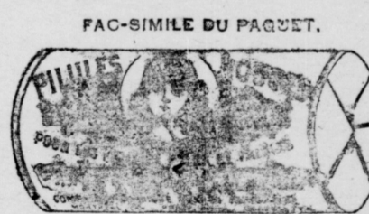
Le papier est blanc imprimé en encre rouge.

AVIS A NOS PATIENTES. Nous attirons votre attention sur le fait très important que nous avons rattaché le nom du Dr. Coderre de tous nos remèdes. Nos PILULES ROUGES, seront donc connues à l'avenir sous le nom de : PILULES ROUGES de la CIE CHIMIQUE FRANCO-AMERICAINE. Pour le plus grand intérêt de nos patientes, nous avons cru faire ce changement, elles devront donc comme par le passé, et plus que jamais, exiger que le nom de la CIE CHIMIQUE FRANCO-AMERICAINE, soit sur chaque boîte, c'est le seul moyen d'avoir les véritables PILULES ROUGES et de se guérir rapidement. Elles devront refuser comme imitation, toutes PILULES ROUGES vendues de porte en porte et aussi celles vendues au 100 ou à 25c. la boîte.