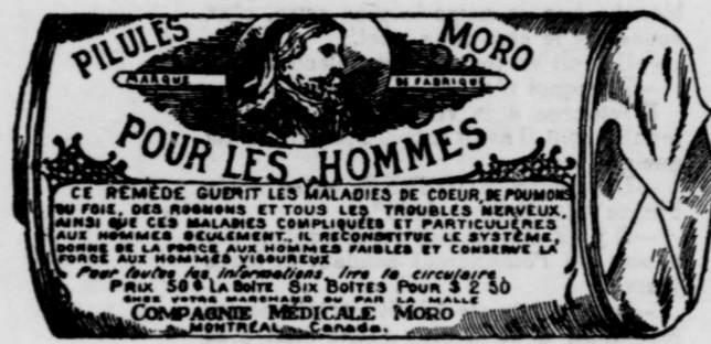
L'Etiquette est de papier blanc imprimé en bleu.

Fac-Simile exact d'une boîte de Pilules Moro.