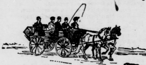
NEW PATIENTS ON WAY TO HOSPITAL

No effort is being spared to meet every call. . . . Not a single applicant has ever been refused admission to the Free Hospital because of his or her poverty,