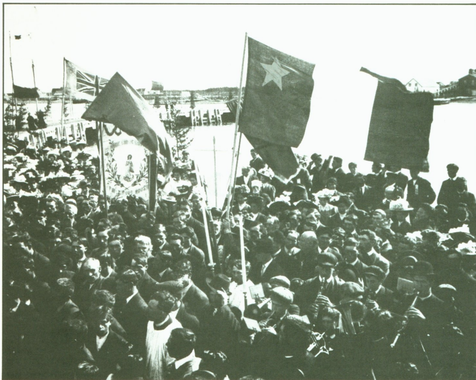
Manifestation religieuse à Shippagan, vers 1907.

çaise. Malgré cette contestation dans certains quartiers acadiens de la fin du 19 e siècle, le drapeau tel que choisi lors de la Convention de Miscouche est devenu, au cours des années, le plus puissant symbole d'identité culturelle du peuple acadien.