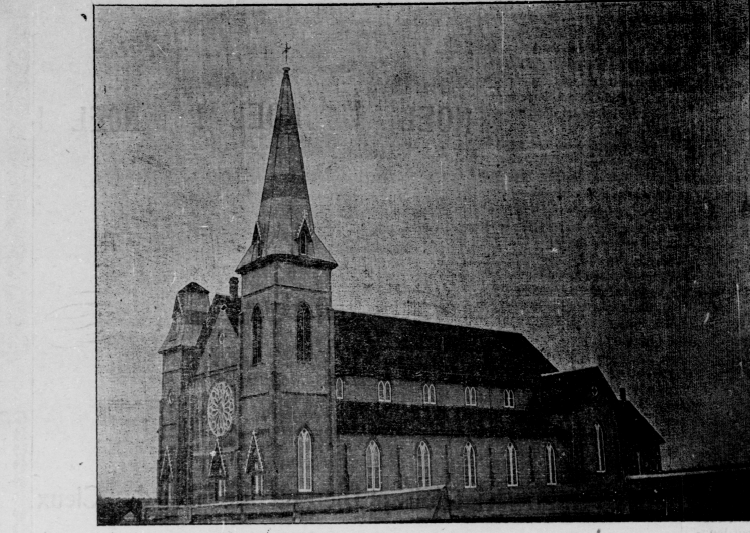
L'Eglise de Palmer Road

M. Myrens sourit, puis il répondit : — Mais oui, on m'en a déjà fait le reproche, mais je suis dans la tradition des socialistes internationaux. Pour moi, la religion est une affaire privée ; je l'ai dit et le répète, et c'est ainsi que le comprennent notamment les Allemands. Ma campagne électorale d'ailleurs a été une campagne à l'allemande.