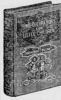
16mo, 144 pages; bound in linen, gilt top.