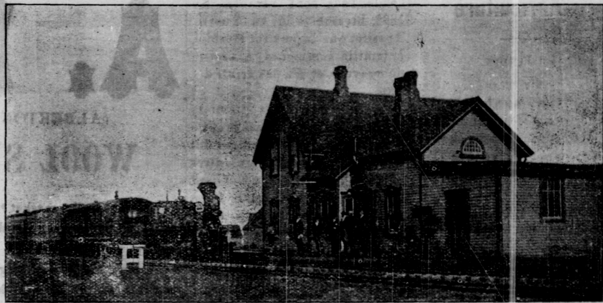
LA GARE, TIGNISH