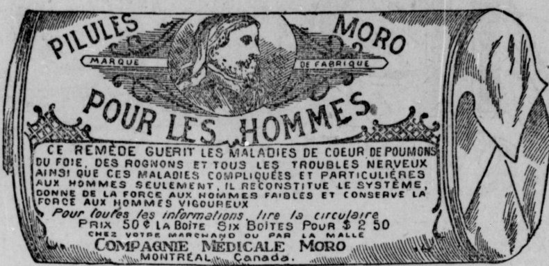
Fac-Simile exact d'une boîte de Pilules Moro.

Donnez-nous un homme brisé par les excès, la dissipation, un travail trop dur, les tracas, ou par toute autre cause qui ait sapé sa vitalité, avec les Pilules Moro nous le rendrons aussi vigoureux en tous points, que n'importe quel homme de son âge.