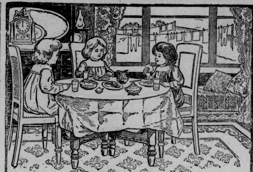
Les jeunes filles Sunlight ont toujours fini leur lavage à midi.