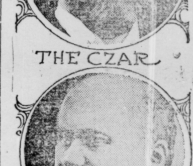
PRESIDENT OF FRANCE