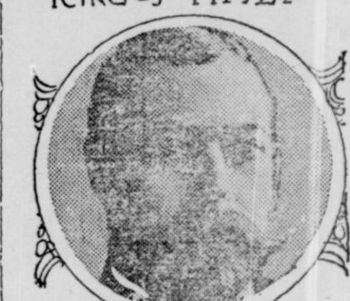
KING OF ENGLAND