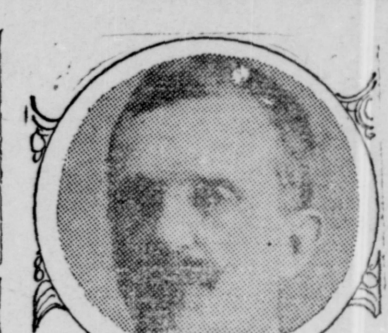
KING OF ITALY