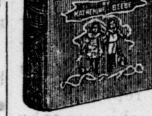
16mo, 144 pages; bound in linen, gilt top.