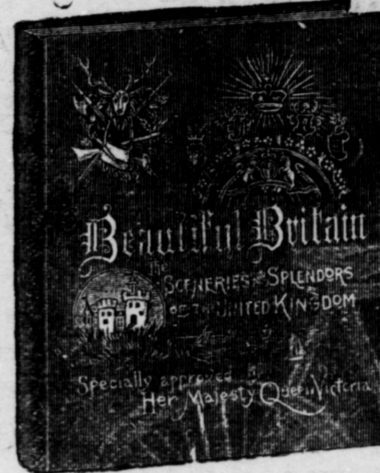
Large quarto volume (11 1/4 x 13 1/4 ins.), 356 pages. Extra enameled paper. Extra English cloth, emblematic embossing in ink and gold.

A magnificent collection of views, with elaborate descriptions and many interesting historical notes. Text set within emblematic borders, printed in a tint. A fine example of up-to-date printing.