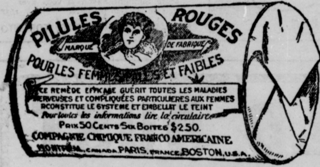
L'Etiquette est de papier blanc imprimé en rouge.

Fac-Similé exact d'une boîte de Pilules Rouges.