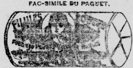
Le papier est blanc imprimé en encre rouge.

Pour le plus grand intérêt de nos patientes, nous avons cru faire ce changement, elles devront donc comme par le passé, et dans ce cas, exiger que le nom de la CIE CHIMIQUE FRANCO-AMERICAINE, soit sur chaque boîte, c'est le seul moyen d'avoir les véritables PILULES ROUGES et de se guérir rapidement. Elles devront refuser comme imitation, toutes PILULES ROUGES vendues de porte en porte et ainsi celles vendues au roc ou à l'ég. la boîte.