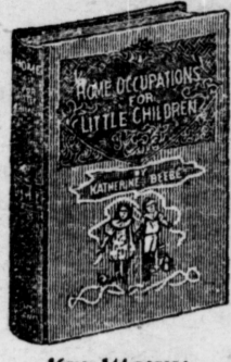
166 pages; bound in linen, gilt top.